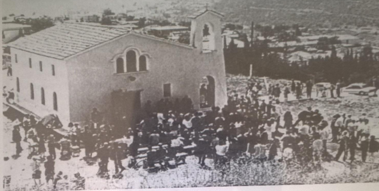
Ειχ. 1. Ὁ ναός τοῦ Ἁγίου Νικολάου στό Ψάρι Κορινθίας τὴν ἡμέρα τῆς γιορτῆς τοῦ νεομάρτυρα (3 Ἰουνίου 2000).