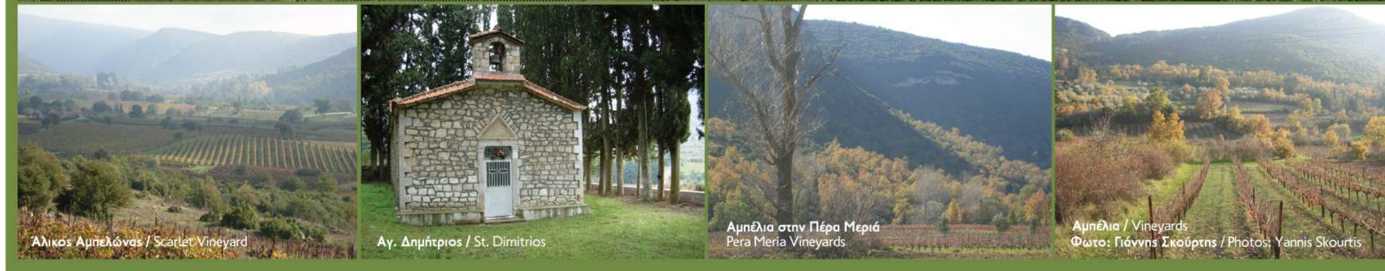
Αλικος Αμπελώνας / Scarlet Vineyard