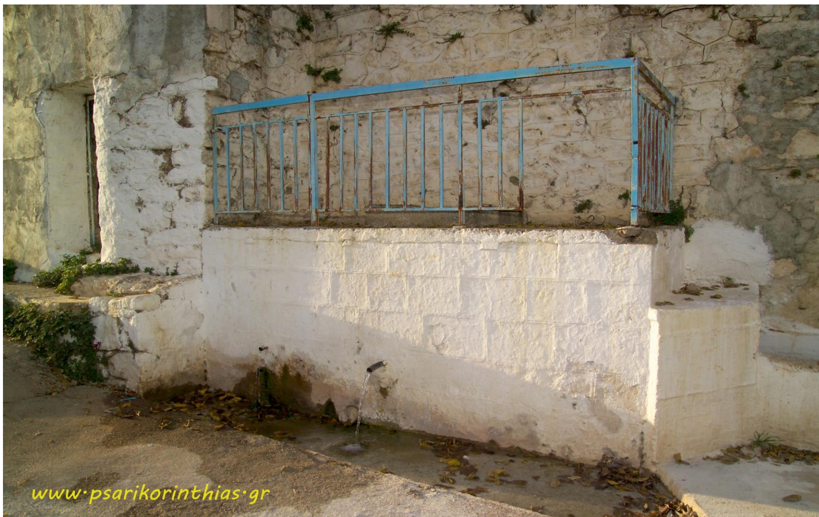
Η βρύση της «Παναγίας» όπως ήταν μέχρι το 2010