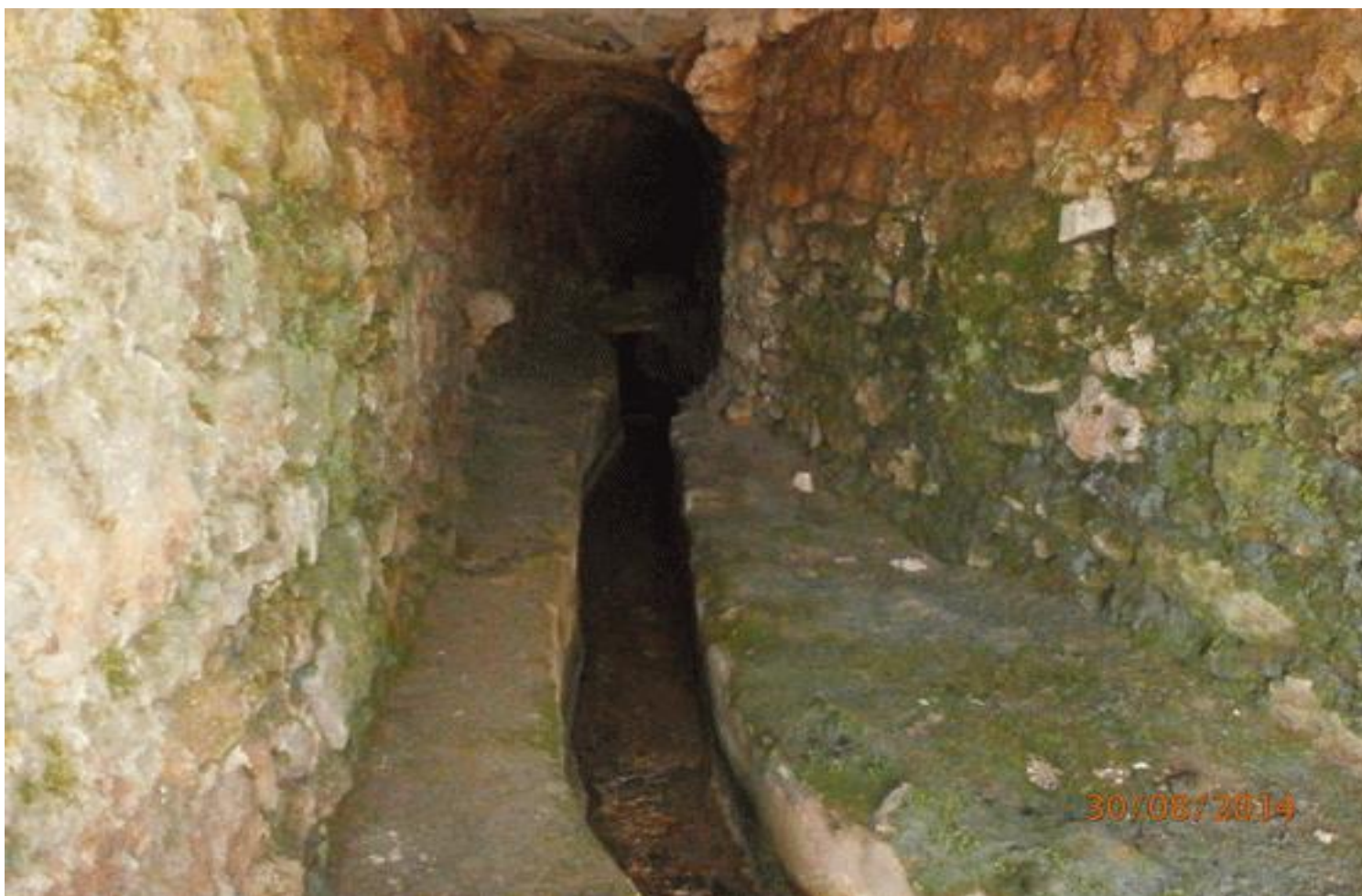
Το κανάλι του νερού που δημιουργήθηκε κάτω από το Ναό για να το οδηγήσει στην υπάρχουσα βρύση