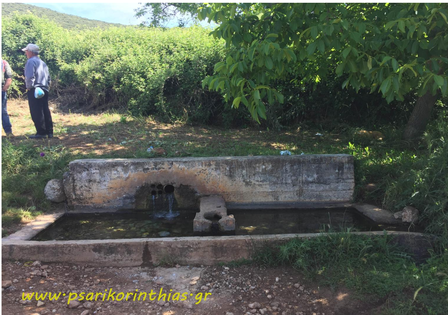
Η βρύση κατά το χρονικό διάστημα 1970 - 2021