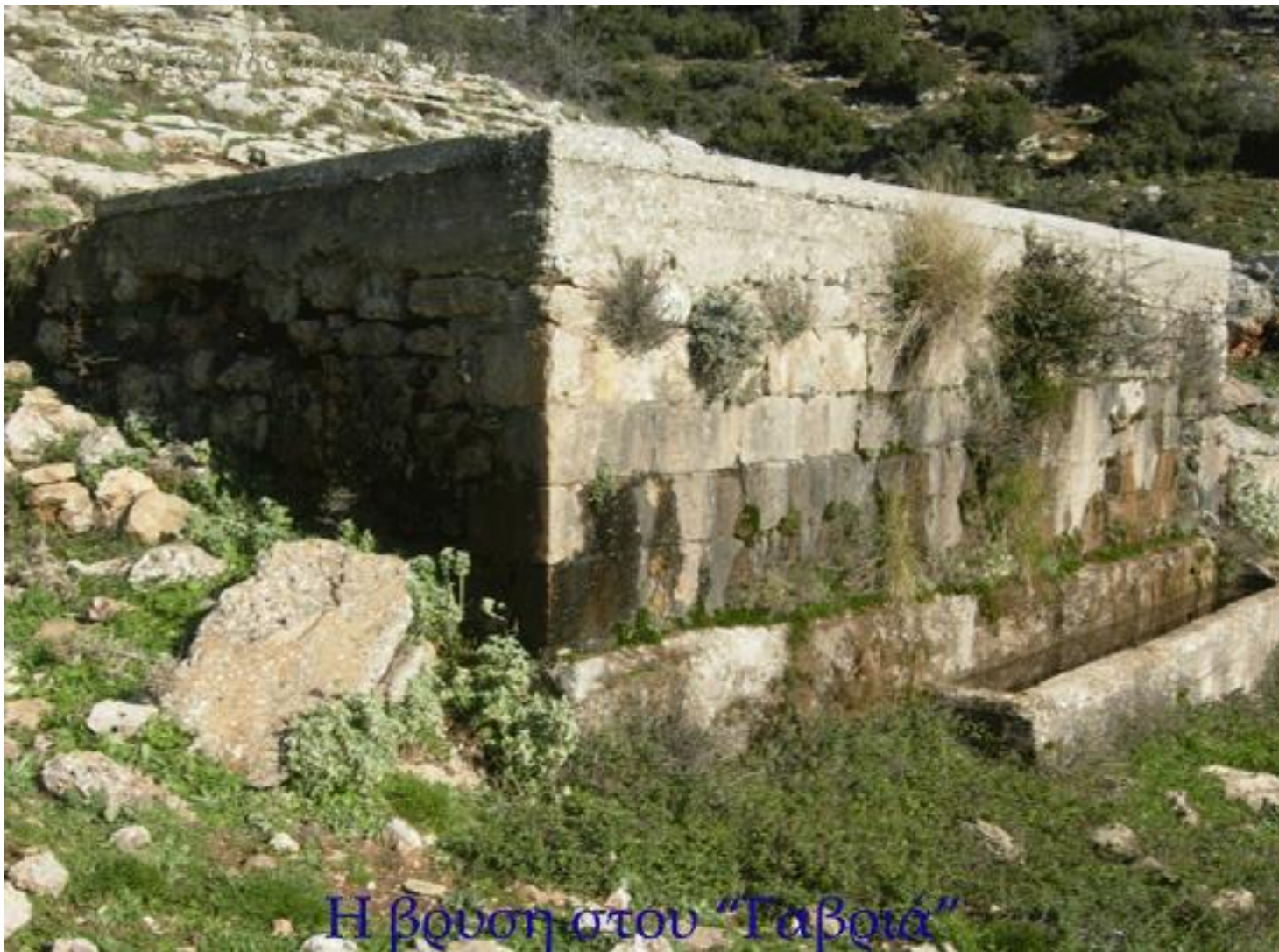
Η βρύση του "Ταβριά"