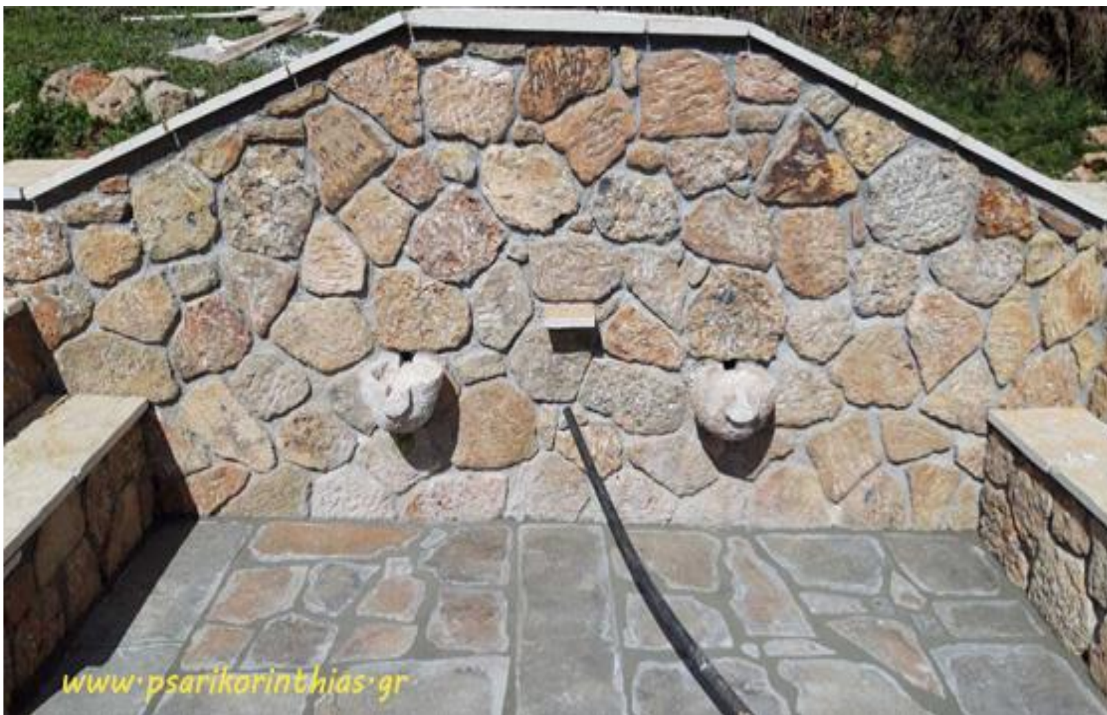
Η «Κουφόβρυση» όπως είναι σήμερα (τις ημέρες κατασκευής της)