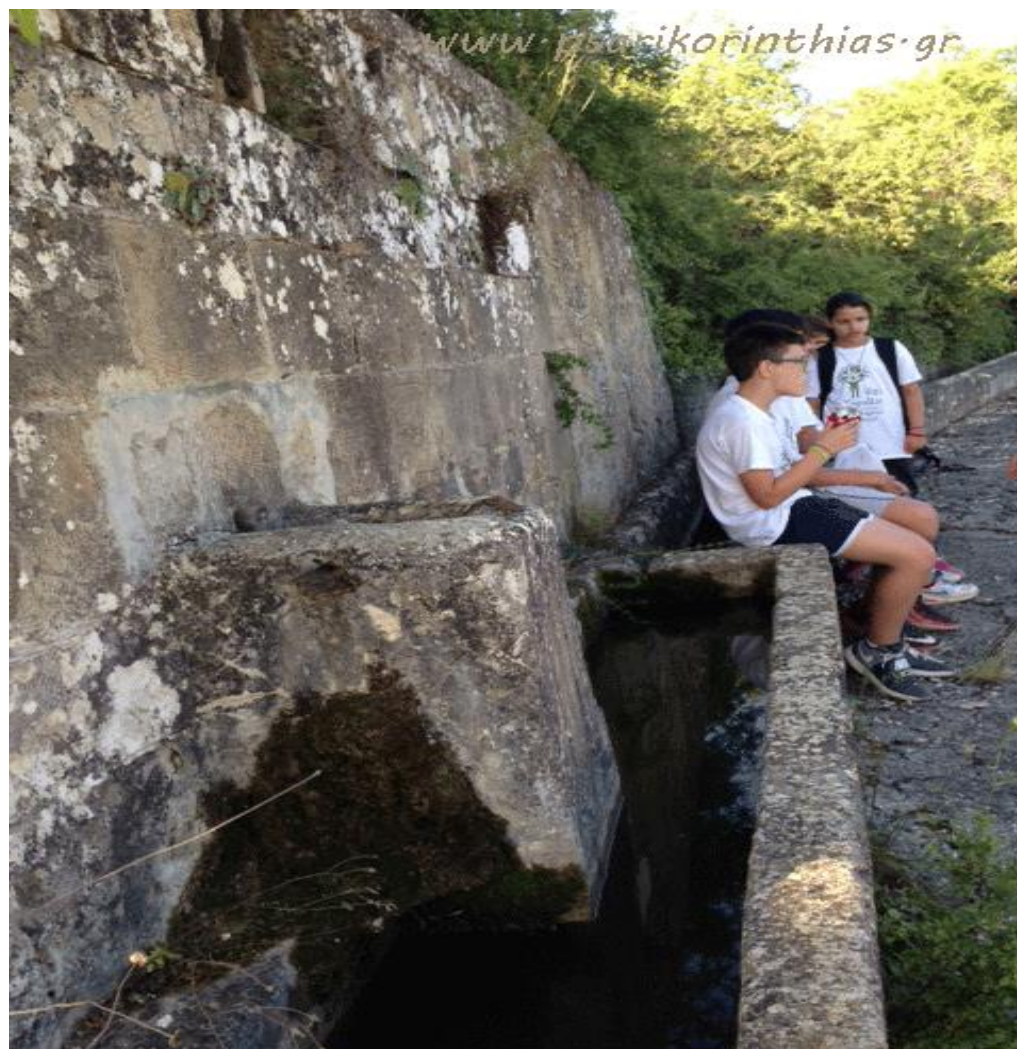
Τα παιδιά του χωριού μας στον «Κάναλο»