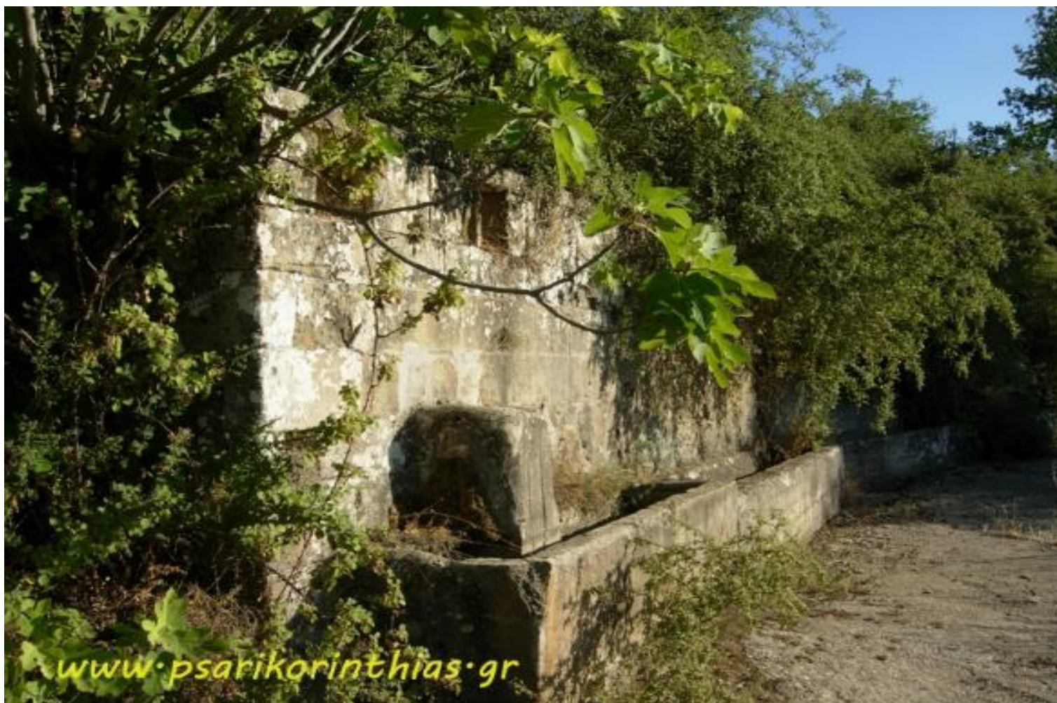
Η φύση «αγκάλιασε» τον Κάναλο ...