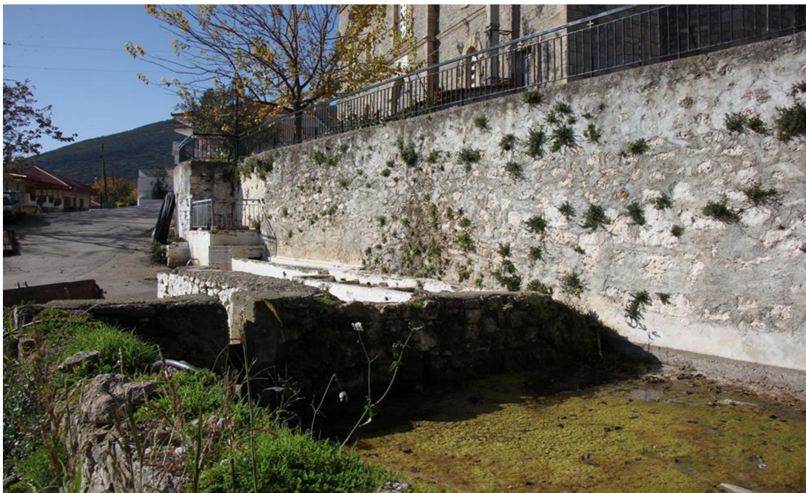
Η βρύση, οι γούρνες & η ασκέπαστη «στέρνα» που δροσίζει και δροσίζει τα περιβόλια του χωριού μας