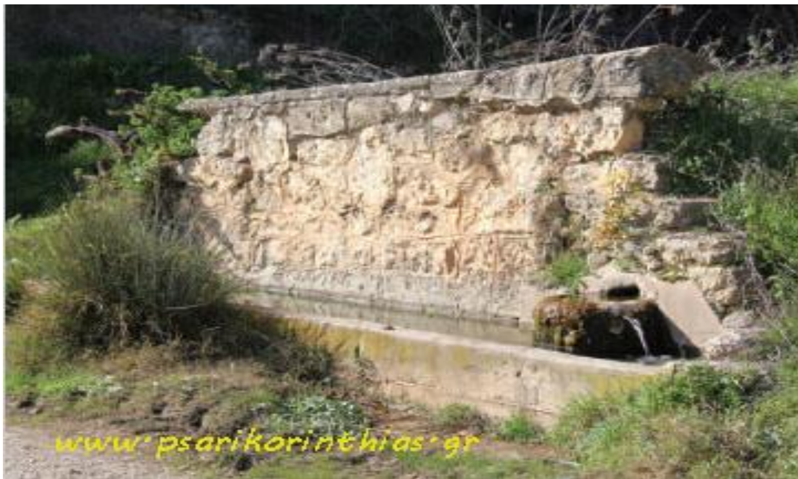
Η «Κάτου Βρύση» πριν την ανακαίνισή της