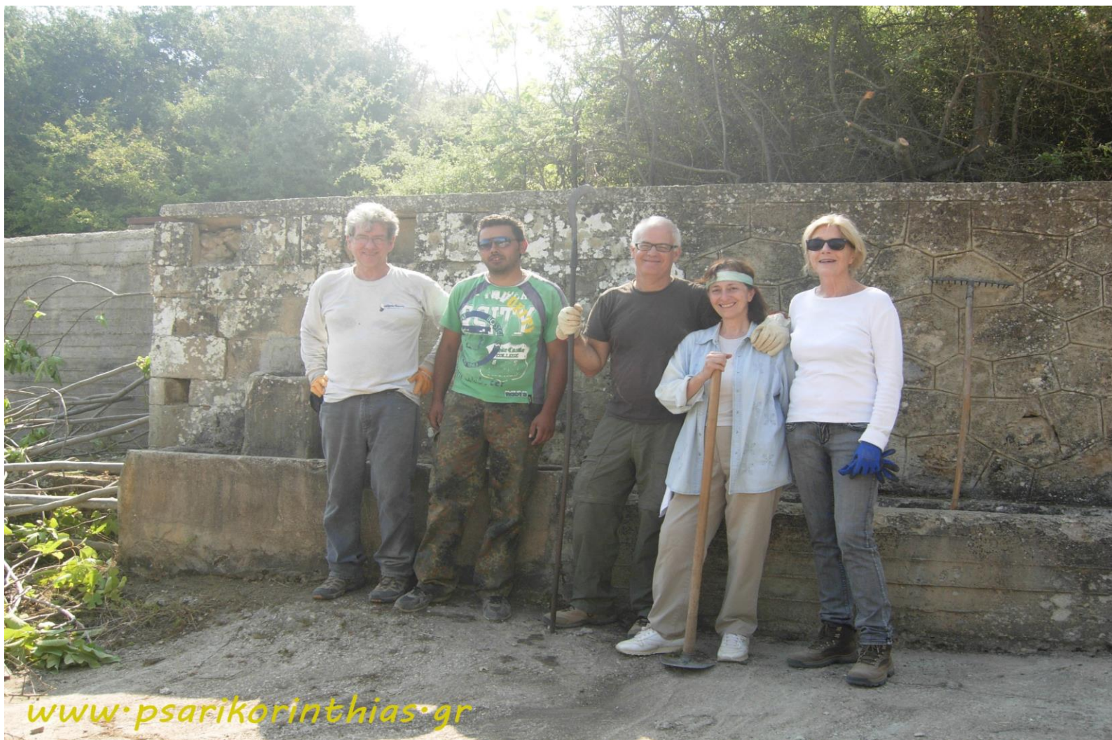
2012 : Καθαρισμός της βρύσης από τα κλαδιά που κόντευαν να την εξαφανίσουν