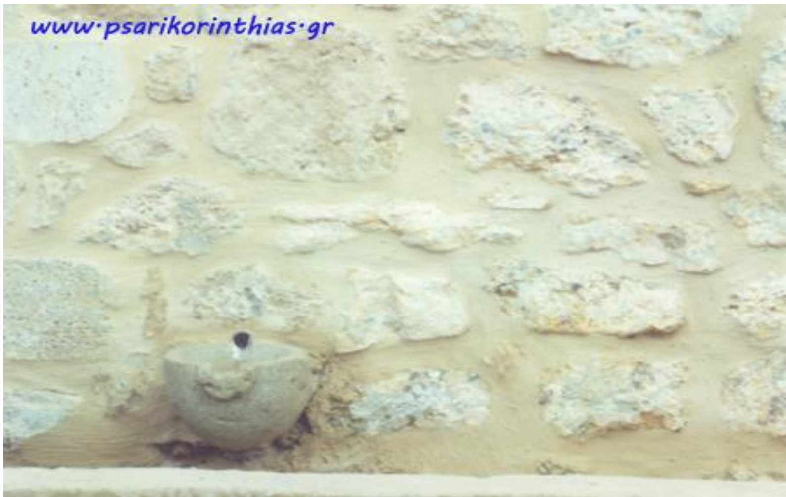
Η «Κάτου Βρύση», όπως είναι μετά την ανακαίνισή της το 2011