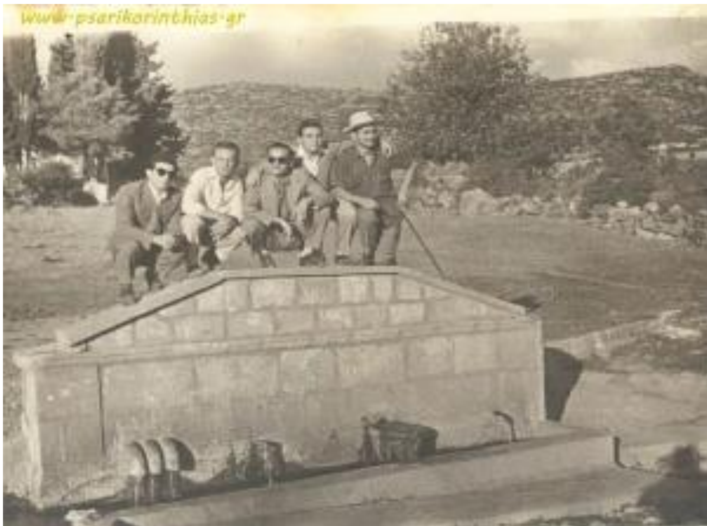
Η «Κουφόβρυση» μέχρι τη δεκαετία του 1970. Πίσω αριστερά το ξωκλήσι του Αγ.Δημητρίου